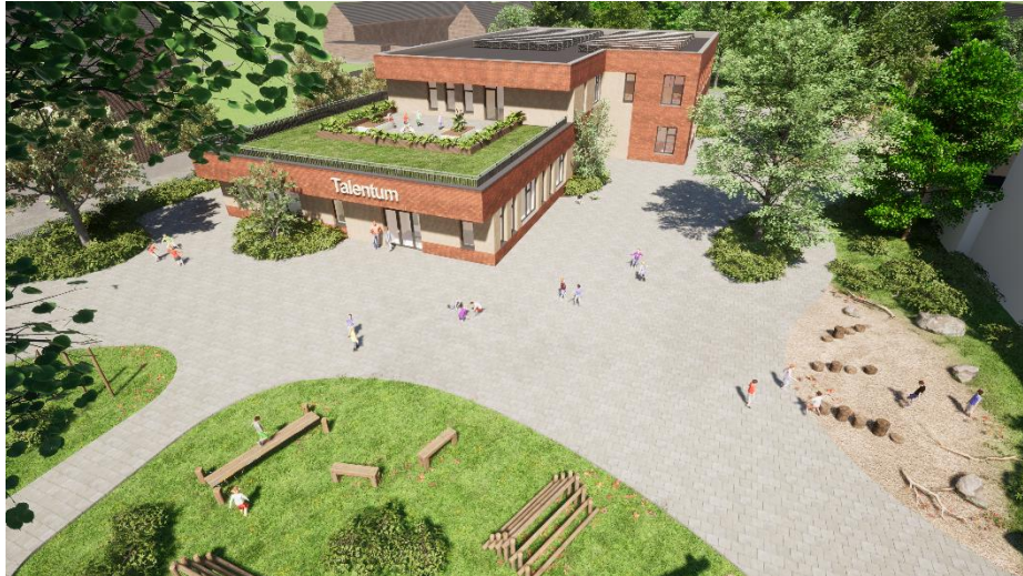
Impressie van de bovenkant