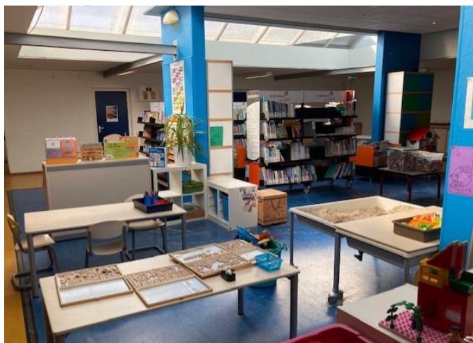
Leerplein groepen 1 t/m 4 (oude gebouw)