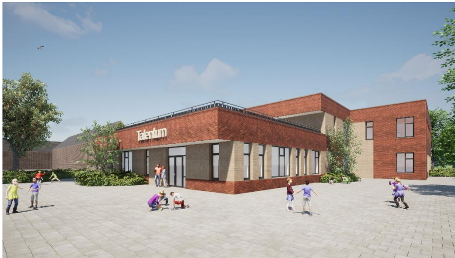
Impressie van de hoofdingang

Het nieuwe gebouw komt op dezelfde plek te staan als het huidige gebouw. Op de begane grond zijn diverse kantoren, de speelzaal, de lokalen en het leerplein van de onderbouw, de centrale hal met de bibliotheek en de lokalen van Partou. Op de eerste verdieping zijn twee kantoren en de lokalen en het leerplein van de bovenbouw. Ook is er op de eerste verdieping een 'buitenlokaal' waar natuurlessen gegeven kunnen worden. Het gebouw voldoet aan alle moderne bouweisen, o.a. op het gebied van ventilatie en duurzaamheid.