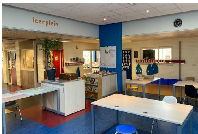
Leerplein groepen 5 t/m 8 (oude gebouw)

We starten een les met alle leerlingen van de groep. Zo leren we ze om goed met het doel van de les bezig te zijn. De uitleg kan plaatsvinden op drie verschillende niveaus. Naar aanleiding van deze uitleg gaan de leerlingen aan het werk met hun opdrachten. Sommige leerlingen geven we, indien nodig, op een andere manier uitleg. We passen de opdrachten aan, aan de behoefte en mogelijkheden van elk kind. Soms maken leerlingen wat minder opdrachten of mogen ze er langer over doen. Het kan ook zijn dat ze extra opdrachten krijgen omdat ze meer uitdaging willen. Regelmatig maken de leerlingen een toets om te kijken of het gewenste resultaat is bereikt. Naar aanleiding van de toets krijgen ze eventueel extra instructie en/of verdiepingsstof.