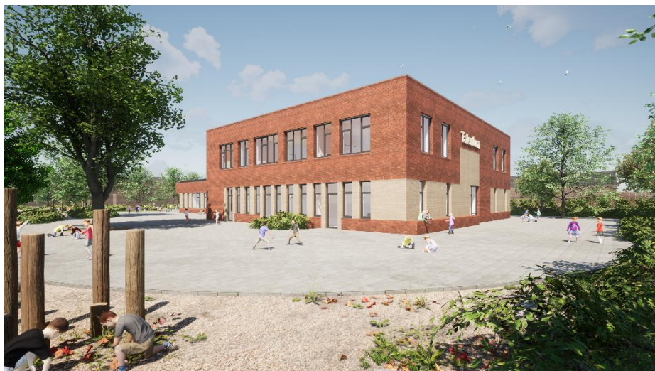
Impressie van de zij- en achterkant