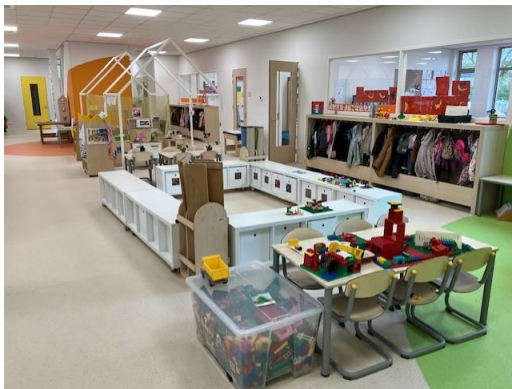
Leerplein groepen 1 t/m 4

Op Talentum hanteren wij een leerstofjaarklassensysteem. Dat betekent dat leerlingen op leeftijd in een bepaalde jaargroep zitten. In de ochtend besteden we aandacht aan de vakken rekenen, taal, spelling en (begrijpend) lezen. Dit gebeurt in de eigen groep. 's Middags werken de leerlingen aan de overige vakken. Dit gebeurt zowel in de lokalen als op de leerpleinen en waar mogelijk groepsdoorbrekend.